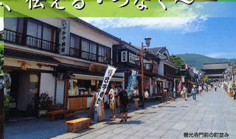
善光寺門前の町並み